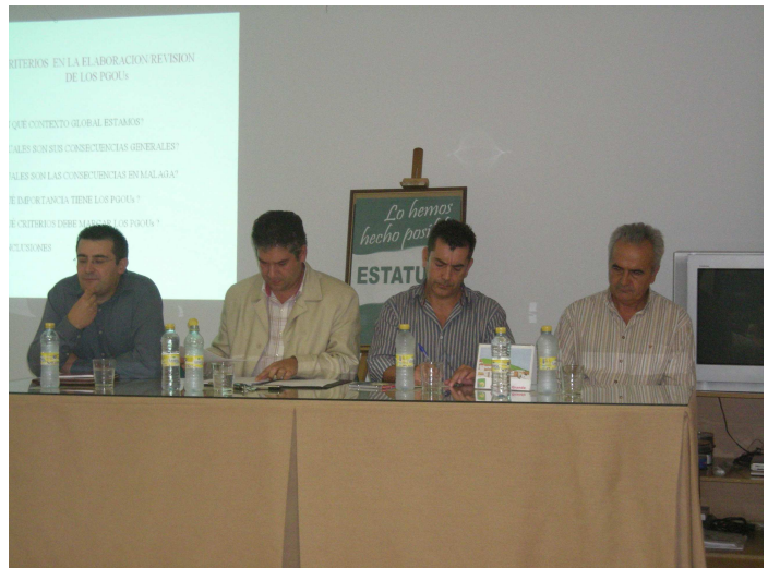
Jornadas sobre PGOU en Alhaurín el Grande

• El 8% de la superficie agraria del Guadalhorca está en producción ecológica. La A.E. es un instrumento de generación de empleo, de cultura, de conservación del medio ambiente y de desarrollo sostenible. Es un escenario ideal para la educación en valores, turismo, empleo, etc.