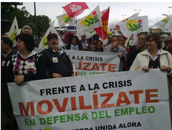
Manifestación en Sevilla