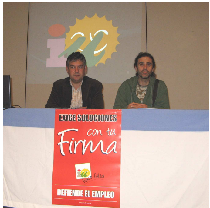
Charla sobre la crisis en Coín

mación tenga un papel fundamental para la creatividad y la innovación.