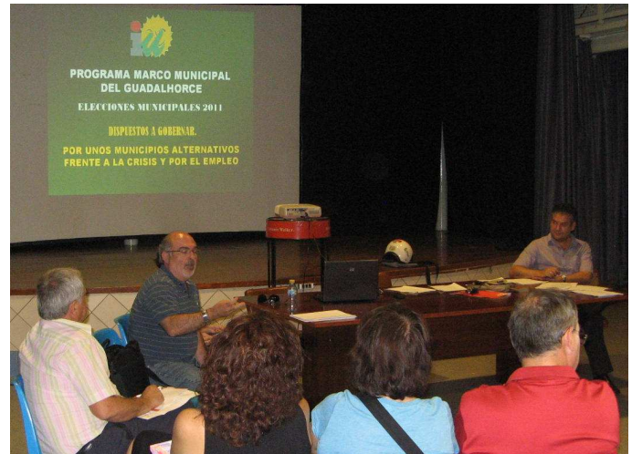
Jornadas comarcales programáticas

El Guadalhorce está en una zona estratégica , situándose a 30 kms de Málaga y a 30 kms de Marbella. Somos una comarca que se enfrenta a retos importantes: la situación del desempleo con una